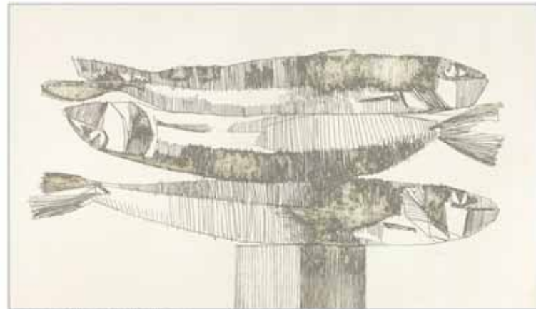
[Sardinat ], 2005. Acqua forte. 49x26cm