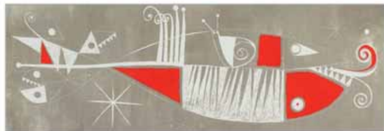
[Poisson fête ], 2006. Acqua forte. 31x12cm